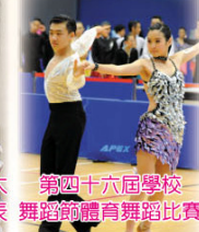
第四十六屆學校 舞蹈節體育舞蹈比賽