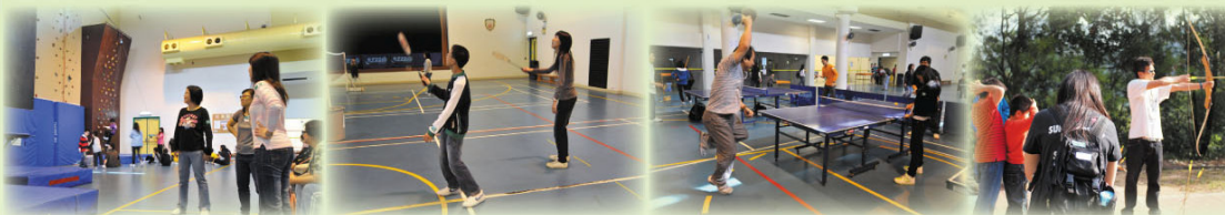
大家盡情享用營地設施