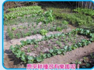
原來耕種很有樂趣呢！