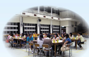
歡迎加入家教會義工組的大家庭