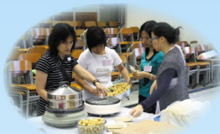
義工家長正在製作茶點·美味魚蛋和燒賣