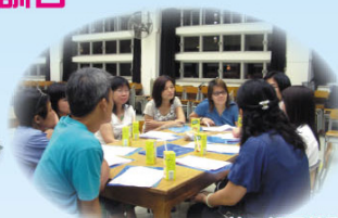
義工組員熱烈討論·互相認識