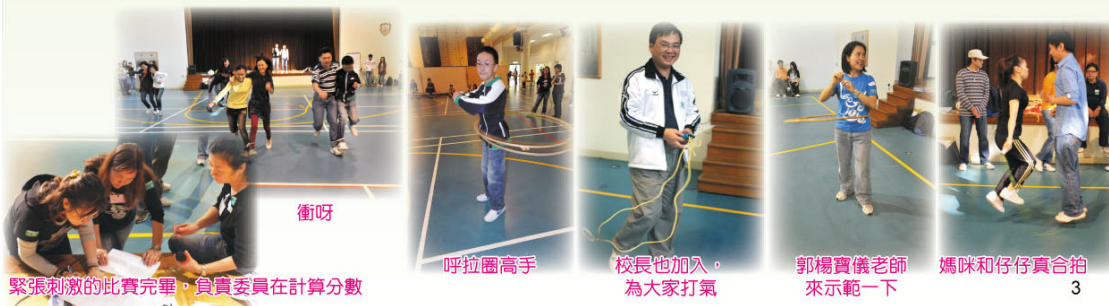
緊張刺激的比賽完畢，負責委員在計算分數