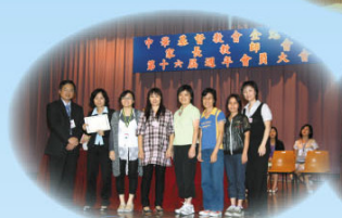
校長頒發感謝狀予義工家長