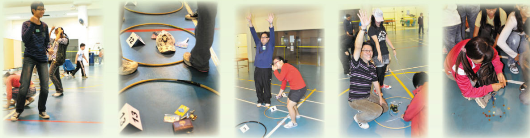
家長、學生、老師，一樣落力！