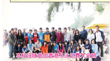
本校泳隊參加香港冬泳比賽大合照