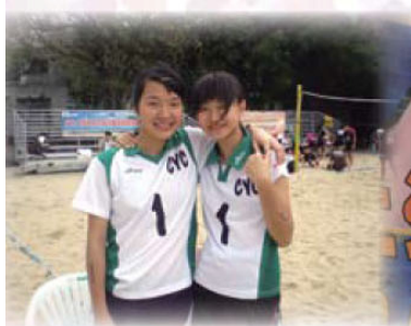
新界地域中學校際沙灘排球比 賽女子組亞軍