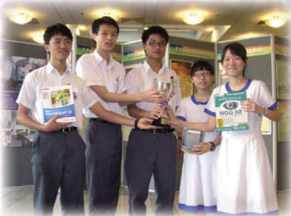
數碼媒體由我創2009中學組亞軍