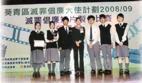
葵青區「滅罪倡廉」IT大使暨滅罪宣傳短片製作比賽 最佳製作技術獎