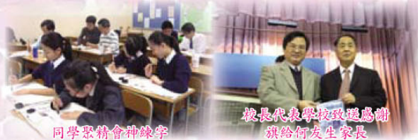
同學聚精會神練字