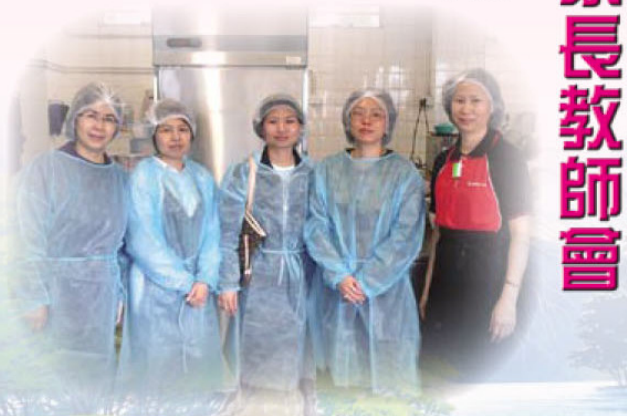
我和執委參觀學校食物部後拍照