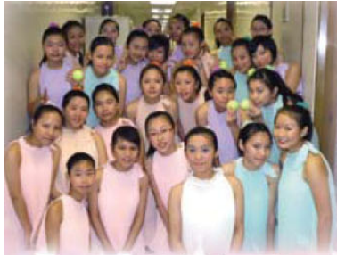
第四十五屆學校舞蹈節現代舞 (中學組)優等獎