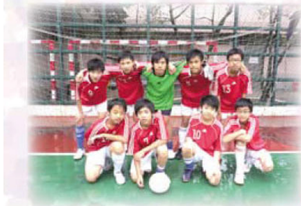
葵青區中學校際男子丙組第二 組足球比賽亞軍