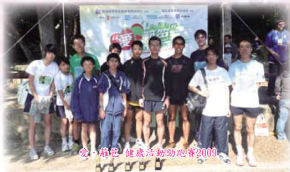
愛·籬笆 健康活動勁跑賽2009