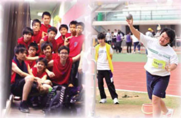
校際籃球比賽男子丙組 第一組第五名