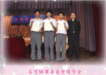
荃灣鄉事委員會獎學金