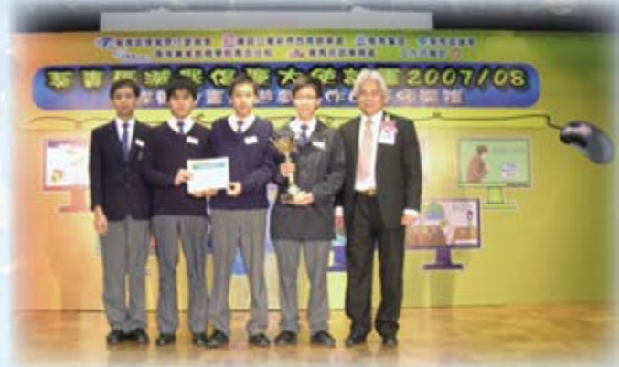
葵青區減罪倡廉IT大使暨電腦遊戲創作比賽冠軍