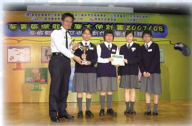
葵青區減罪倡廉IT大使暨電腦遊戲創作比賽季軍