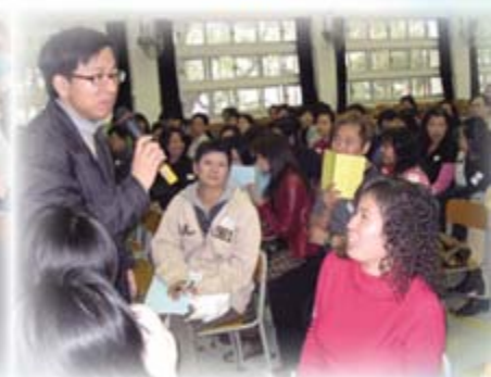
主講嘉賓與家長暢談