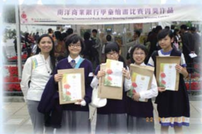
香港花卉展覽2008學童繪畫比賽