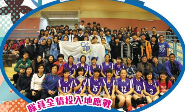
隊員全情投入地應戰