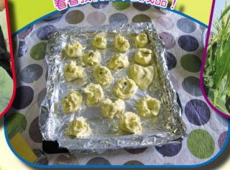
看看我們的半製成品！