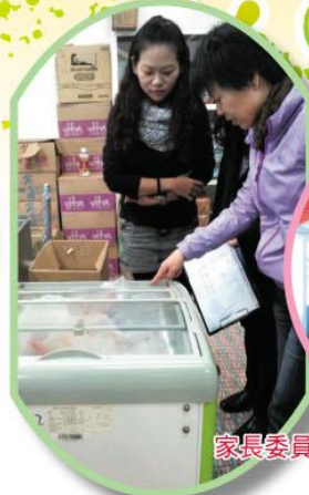
家長委員巡查小食部