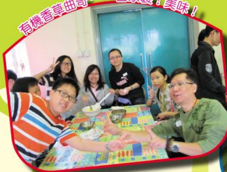
有機香草曲奇……自家製！美味！