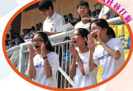
陸運會啦啦隊全力為社員打氣