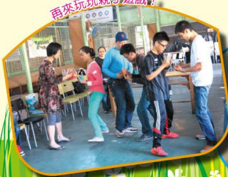
再來玩玩親子遊戲！