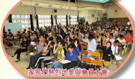
家長們熱烈地參與會員大會