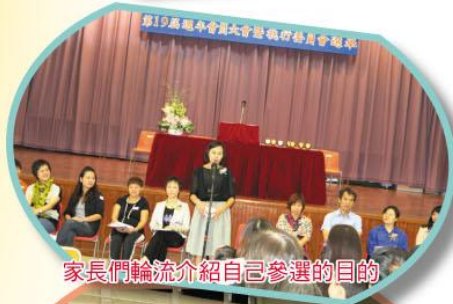
家長們輪流介紹自己參選的目的