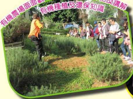
有機農場面觀——導賞員沿途介紹及講解 有機種植及環保知識