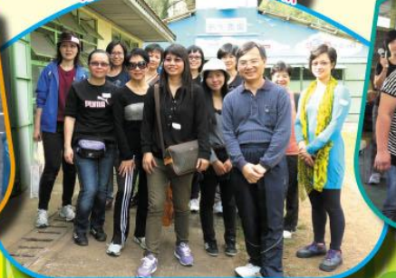
家長委員與老師們合照