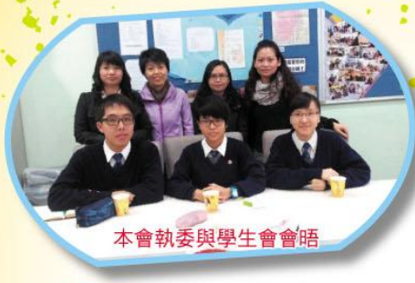
本會執委與學生會會晤