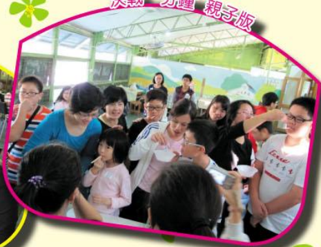
‘決戰一分鐘’親子版