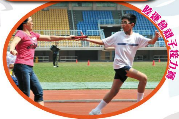
陸運會親子接力賽