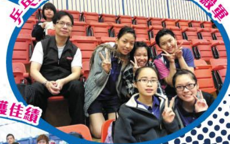
乒乓球隊女子甲組獲校際比賽殿軍