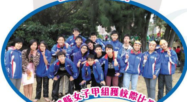
乒乓球隊女子甲組獲校際比賽殿軍